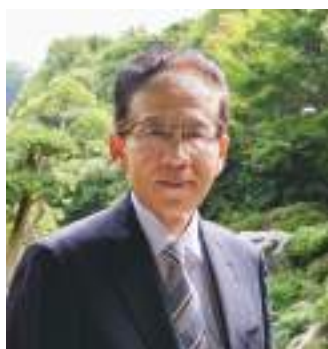
「コロナ禍を経て益々、非日常の癒し需要が高まっている気がします」と話す皆美社長

おもてなし、は形に見えず、数値化できない上、人によっても評価が変わる。マニュアル化できないからこそ、スタッフ一人一人の日々の研さんや創意工夫が求められる。「伝統を継承しているという誇りを糧に成長し続ける必要があります」