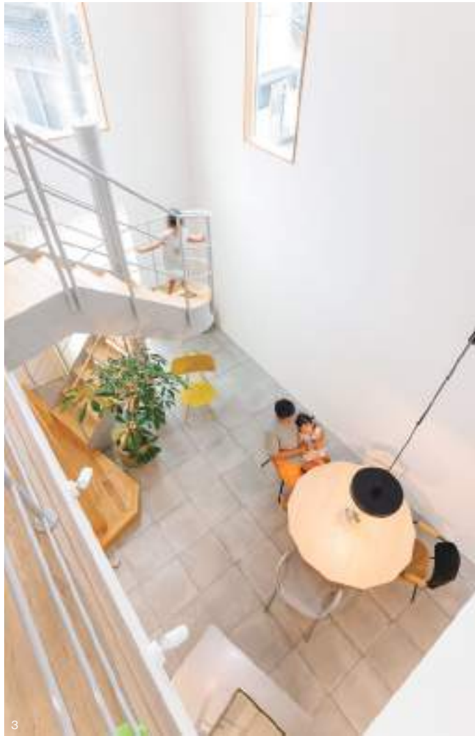
1. 料理好きの奥様が厳選したガスレンジタイプの無垢製アイランドに特注の螺旋階段。そんなこだわりのガジェットで構成された独創的なLDK。吹き抜けの大きな高窓が空間全体をさらに開放的で明るく演出する。2. LDK入口からの眺め。斜め配置のキッチンと無垢床リビングの境界線を並行に設計することで、斬新ながら違和感のないレイアウトを成立させている。3. 2階吹き抜けからの眺め。食卓の位置を自由に変えられるよう、ダイニングの照明には壁付けのスイングタイプを採用。4. 洗練されたスクエアデザインの外観。ニュートラルグレーの外壁に開口部を縁取ったホワイトがアクセントカラーに。